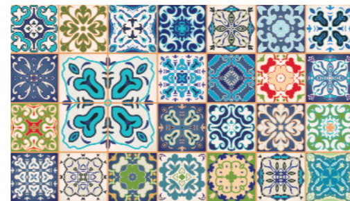
Met Q8Oils creëert u mooie resultaten.